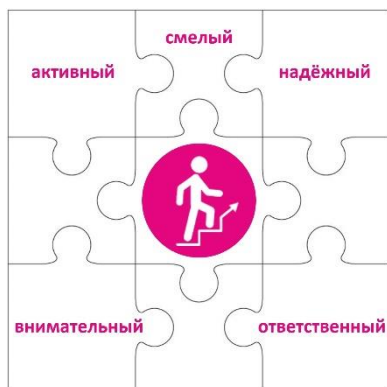
Конструктор «Лидер» 2 класс

Чтобы быть лидером, нужно много знать, уметь вести за собой, постоянно развиваться. Личность лидера многогранна, она словно складывается из множества разных пазлов, которые в целом дают яркую и интересную картинку. Конструктор «Лидер» представляет собой большой пазл, где центральный элемент – символ трека – человек, поднимающийся вверх по лестнице. Остальные части этого пазла – элементы небольшого размера, примерно формата,